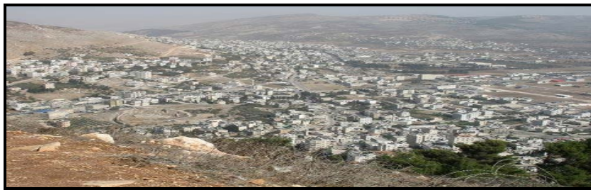
Sichem in der Region Samarias

🔥 “Deinem Samen will ich dieses Land geben!” (1. Mose 12,7).